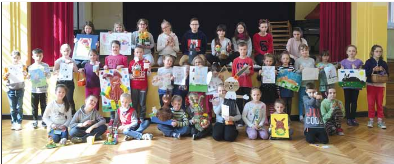
fol. Szkoła Podstawowa nr 4

Samorząd Uczniowski dziękuje za zaangażowanie wszystkim uczestnikom. Opiekunowie Samorządu Uczniowskiego