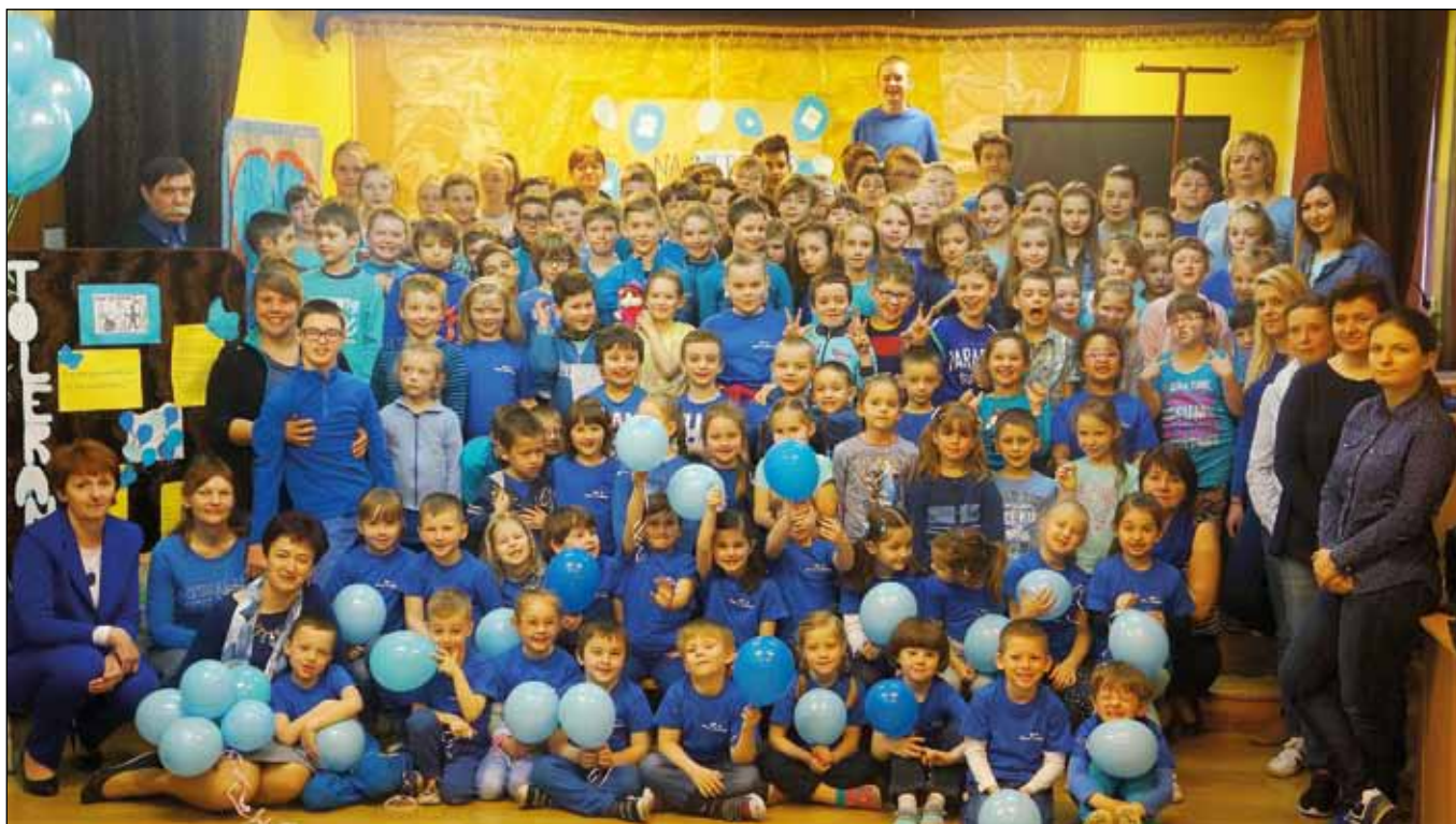
fol. Szkoła Podstawowa nr 5